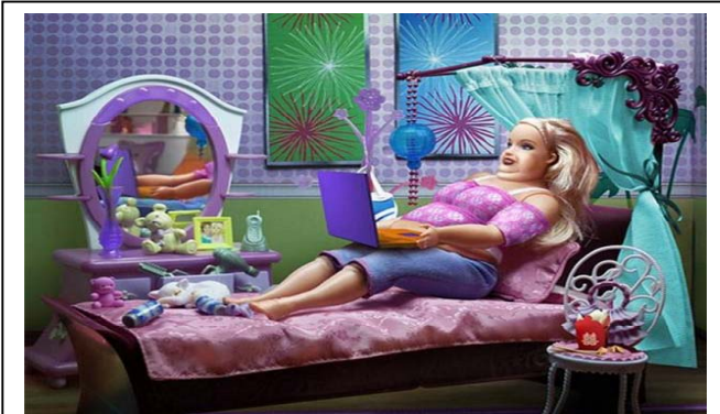
Los meses no pasan sin más y Barbi no es lo que era.