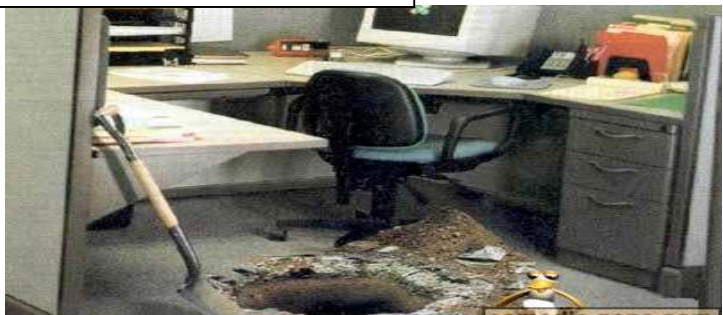
Un grupo incontrolado se fuga por un túnel, excavado por ellos mismos, para escapar del mal clima laboral reinante.