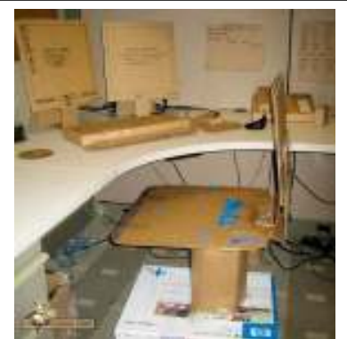
Algunas condiciones de trabajo no fomentan la felicidad

Se confirma que el cambio climático afecta al Ayto. Tan solo con darse un paseo por sus instalaciones se puede comprobar la frialdad existente entre sus emplead@s, frente a otras épocas mucho más cálidas y acogedoras. Parece que hay quien piensa que un trabajador feliz es peligroso, haciendo todo lo posible para que quienes le rodean no lo sean. ¡NO TE RINDAS, NO AL CAMBIO CLIMÁTICO!, ríete cuando quieras, sal a desayunar con tus colegas, recuerda que una sonrisa es salud, estar amargado produce úlcera de estómago.