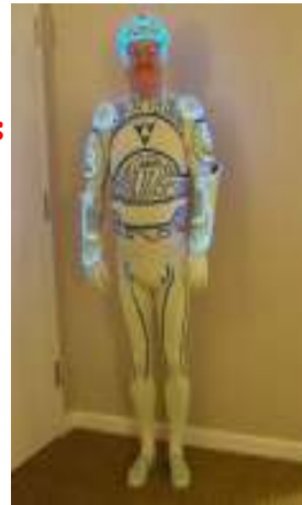
Corresponsal o parecido del T.B.O. en RR.HH. de Majadahondum

* La inspección de trabajo da la razón a los representant@s de los trabajador@s y se la quita a los responsables de RR.HH., ante la reclamación efectuada para poder ser parte en los tribunales de selección de personal en su condición de miembros del Comité y no como colegas.