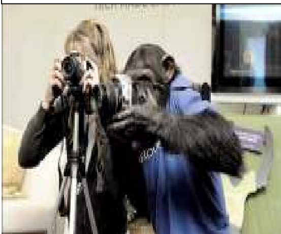
Corresponsal del TBO durante la presentación en el salón de plenos de Majadahondum.

Los principales puntos planteados por el Equipo de Gobierno cara a la futura negociación colectiva y, con la crisis como telón de fondo son: