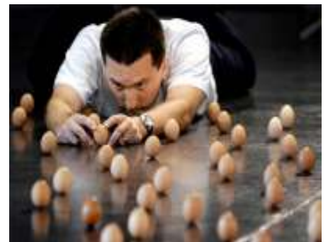
Cuestión de huevos

Si se repartiera el dinerito que se le dará a la banca entre los españolitos, se calcula que tocaríamos a unos cinco mil € por barba, pues eso, a repartirlos. Después cada cual podría prestárselo al banco más necesitado con un bajo interés y si hace falta le regalamos un edredón. Parece que esto es más lógico que darles directamente nuestro dinero a la banca para que luego nos lo preste a nosotros y encima les demos intereses por habérselo dejado?????, más que nada por si se quedan con el edredón.