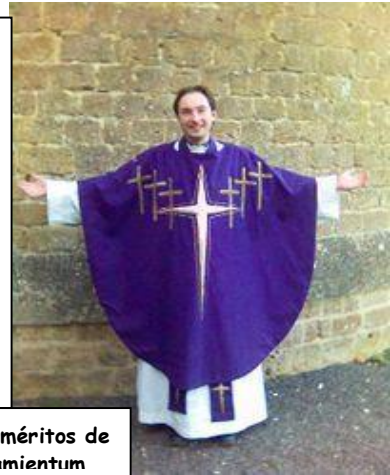
Momento de la valoración de méritos de un/a candidato/a al Ayuntamiento

Lo que no nos quedan claras son las bases de selección para los curas candidatos, ni las tasas por derecho de examen para estos. JO, CÓMO ESTÁ EL PATIO.