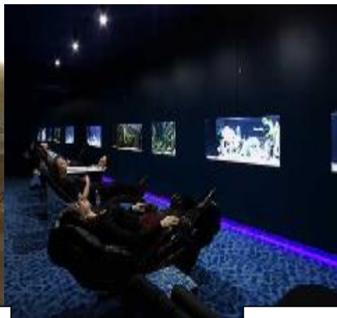
Salas para relajarse