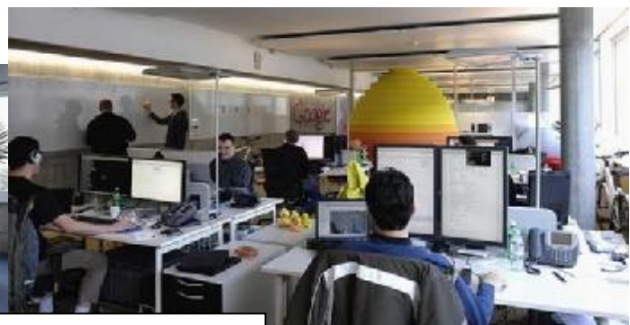
Lugares de trabajo espaciosos y acogedores con sistemas informáticos que no se estropean.