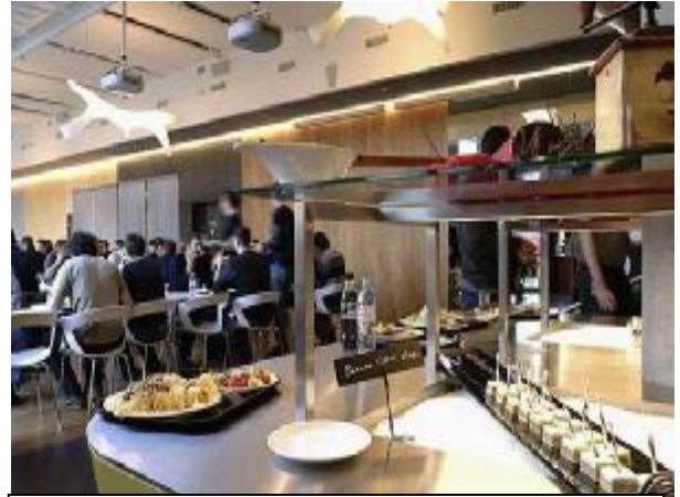
Comedor de Empresa a precios razonables