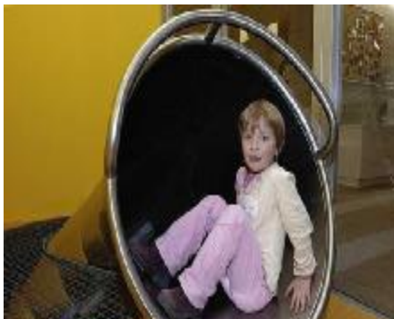
Zona para hi@s de emblesad@s.