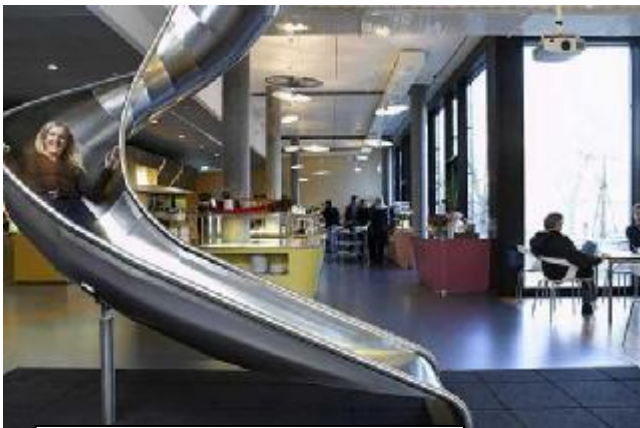
Zonas de descanso para emplead@s