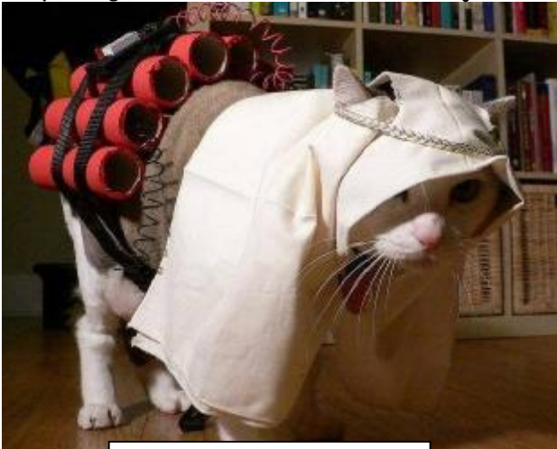
Foto descargada de Internet del Gato Persa

El pasado mes de Abril, en INTERNET, se detectó la presencia de un Gato Persa (Iraní para más señas) con la intención de poner una bomba fétida en el Ayuntamiento de Majadahondum. Las sospechas comenzaron en Navidades, cuando vendedores de la Pza. Mayor en Madrid detectaron la presencia de un "hombre bajito, peludo y con gabardina" que compraba gran cantidad de bombas fétidas junto con alguna caca de plástico (pensamos que para disimular).